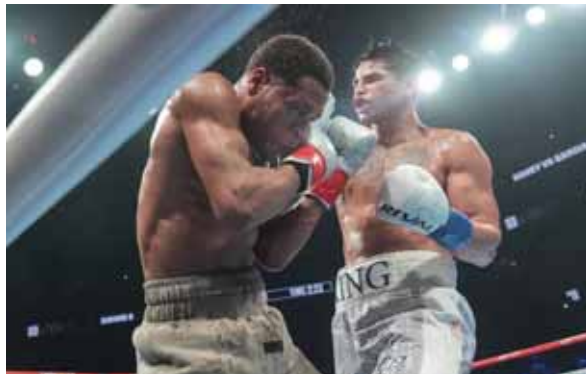
Ryan García, a la derecha, golpea a Devin Haney durante el octavo asalto de un combate de boxeo superligero la madrugada del domingo 21 de abril de 2024 en Nueva York.

manos fueron demasiado para Haney, quien se lastimó desde el primer asalto y cayó en el séptimo, décimo y undécimo.