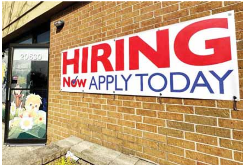
Anuncio de oferta de empleo en Riverwoods, Illinois, el martes 16 de abril de 2024.

El mes pasado, los empleadores estadounidenses añadieron la sorprendente cantidad de 303,000 empleos, en otro ejemplo de la resiliencia de la