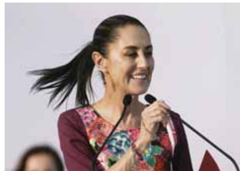
La candidata presidencial Claudia Sheinbaum habla durante su mitin de apertura de campaña en el Zócalo de la Ciudad de México, el 1 de marzo de 2024.

Los primeros judíos llegaron a México en 1519, junto con la colonización española. La comunidad comenzó a crecer sustancialmente a principios del siglo