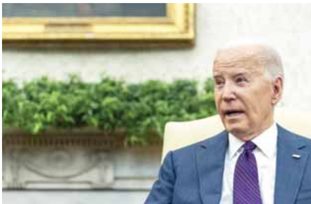
El presidente Joe Biden habla mientras se reúne con el primer ministro iraquí, Shihab al-Sudani, en la Oficina Oval de la Casa Blanca, el lunes 15 de abril de 2024, en Washington.

Estados Unidos, incluido el Departamento de Estado, los Centros para el Control y la Prevención de Enfermedades, los Servicios Humanos y de Salud y la Agencia de Estados Unidos para el Desarrollo Internacional (USAID), ayudarán a los países a perfeccionar su respuesta a las enfermedades infecciosas.