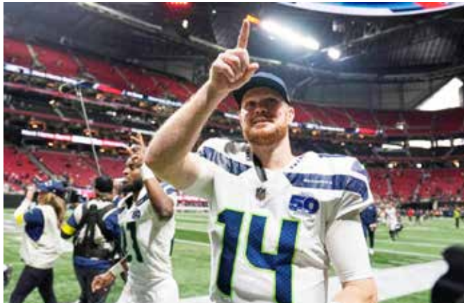
El mariscal de campo de los Seattle Seahawks, Sam Darnold, señala a los fanáticos después de una victoria sobre los Atlanta Falcons en un partido de fútbol americano de la NFL, el domingo 7 de diciembre de 2025, en Atlanta, Georgia.

Seattle se encontraba empatado 6-6 al medio tiempo debido a la incapacidad de los Seahawks para convertir las oportunidades en la zona roja en touchdowns. Uno de los tres goles de campo de Jason Myers esa tarde, uno de 22 yardas, se produjo después de que Darnold lanzara un par de